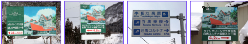
① JR大系線白馬大池駅を越えたとすぐ右手に設置。 ② 国道148号線沿いに設置。この看板を目印に曲がる。 ③ 小谷小学校校舎を右手に越えたとすぐ頭上に設置。 ④ T字路の角、民家の前に設置。これを右折。