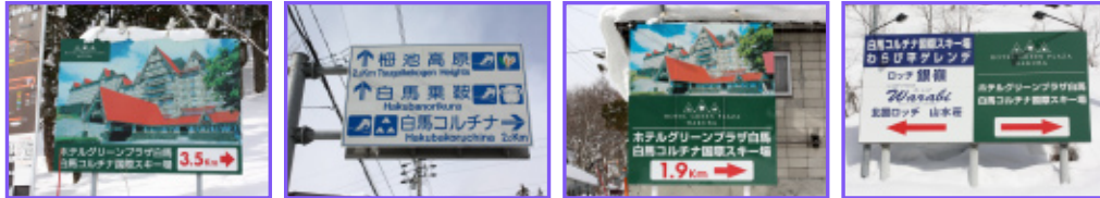
⑤ 経路途中の3.5km地点に設置。越えたとすぐ橋が。 ⑥ 経路途中の2.0km地点に設置。越えたらすぐのが。 ⑦ T字路の角建物前に設置。これを右折。 ⑧ 経路途中わらび平グレンデ入口に設置。

※豊科・長野インターチェンジからお越しのお客様は②の看板すぐのT字路を左折、糸魚川インターチェンジからお越しのお客様は②の看板すぐのT字路を右折して下さい。豊科・長野方面からお越しの場合、②の看板を越えJR南小谷駅に向かう途中に白馬コルチナの看板がありますが、ここの道は高低差がはげしく道幅も狭いのでご案内している経路をご利用下さい。また、糸魚川方面からお越しの場合もご注意ください。 ※わらび平看板⑧は左折せずそのまま道なりにお進み下さい。 この他分からない点がございましたらホテルまでご連絡下さい。